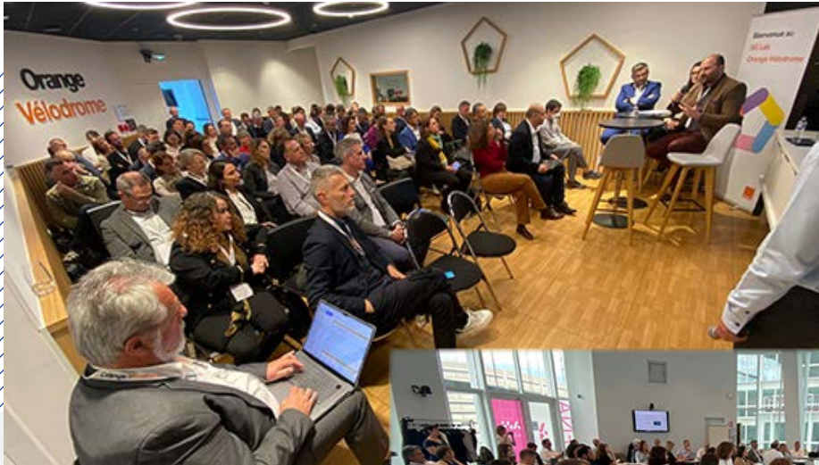
Restitution Orange Lab Marseille - 09/04/2024