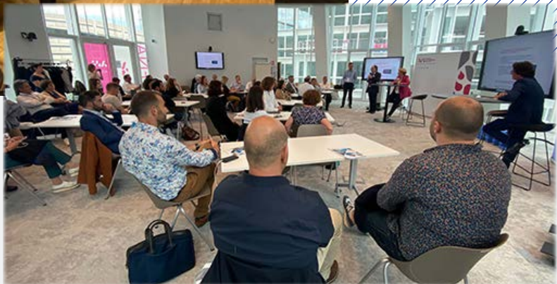
Restitution ParisSanté Campus - 17/05/2024

Les témoignages de nos participants sont unanimes. Le format des conférences privées et les visites de stands avec accueil personnalisé dynamisent les échanges et permettent de belles découvertes. Rejoindre cette délégation pour partir à l'assaut de ce grand salon est un véritable atout.